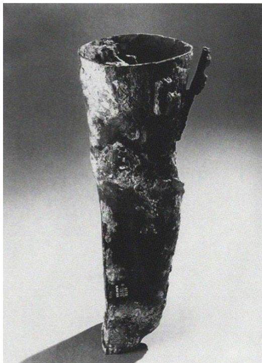
Figura 2 Perna de Capua

Outro indício de prótese, achada antes do “Dedo do Cairo”, data de 300 a.c., conhecida como “Perna de Cápua” e encontrada na Itália. Essa peça produzida na época romana, feita de madeira e revestida de bronze, como a armadura dos soldados, leva a crer que foi construída pelos próprios soldados ou ferreiros de armaduras. A parte superior era oca, para o encaixe da coxa, e na parte inferior também, para um possível pé artificial que era encaixado, mas que no local não foi encontrado. (BLIQUEZ, 1996, p.2667-2668)