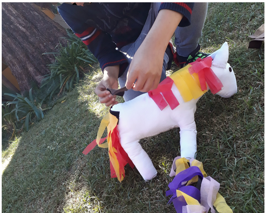
Figura 2 Pé de Pano, Objeto de Aprendizagem Poético foi desenvolvido com tecido, algodão, botões, velcro e TNT

O objeto de Aprendizagem Poético Pé de Pano (Figura 2) possibilitou trabalhar a criatividade e também a assimilação sobre algumas partes do corpo do cavalo durante a sessão de Equoterapia. Em solo, por etapas, pedimos ao praticante para colocar as partes (crina, cola e cascos) no pé de pano, mostrando as duas opções de cores e permitindo que ele faça a sua escolha. Sobre as outras partes do cavalo, como garupa, pescoço, barriga, patas, o praticante pode falar, apontar ou acariciar.