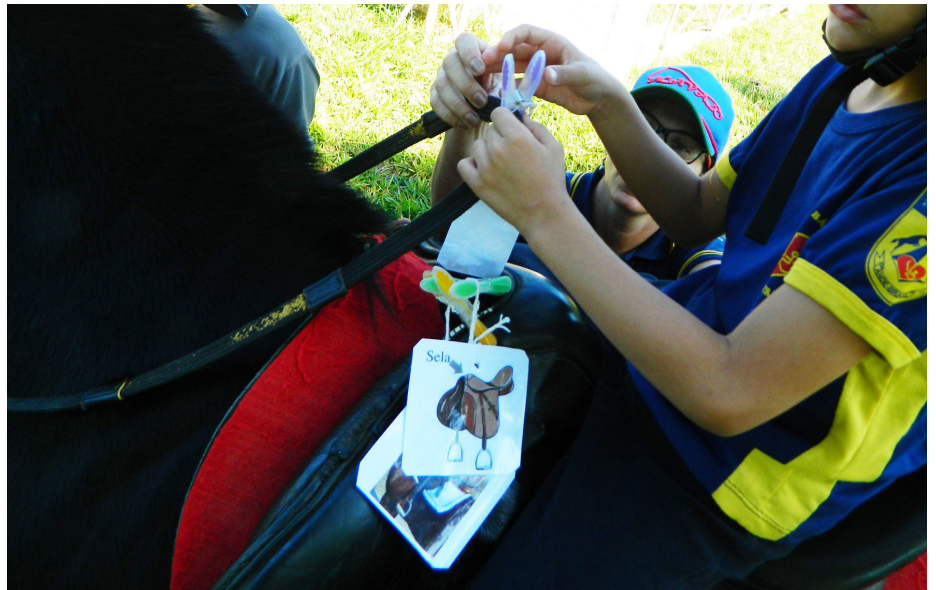
Figura 1 Pregadores de encilhamento, Objeto de Aprendizagem Poético feito com pregadores de roupa, barbante e imagens impressas plastificadas